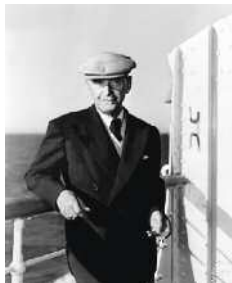
Ernst Krenek – Wien um 1930, Albuquerque 1949 Thomas Mann – Pacific Palisades bei Los Angeles, 1951 und bei seiner Überfahrt nach New York, 1949